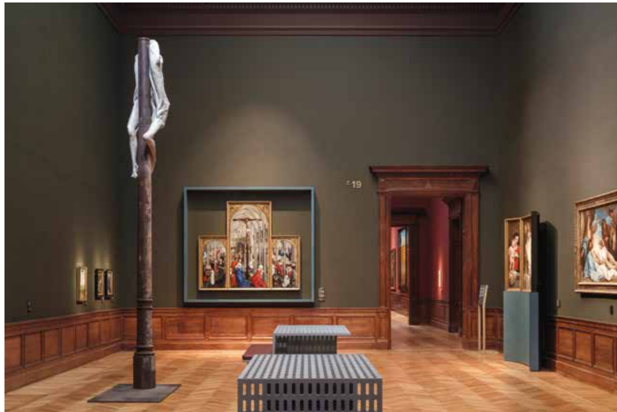
Berlinde De Bruyckere, Schmerzemann I , (2006), polyester, was, ijzer, 530 x 200 x 100 cm, privécollectie. Te zien in zaal 2.19 Lijden.